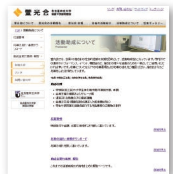
同窓会のサイト内「活動助成」についての説明ページ

萱光会では皆様の社会的活動の支援を目的として、助成金の交付事業をおこなっています。皆様の活動のための一助としてご利用いただければ幸いです。応募の詳細については同窓会サイトの「活動助成」のページをご参照ください。ご応募をお待ちしています。